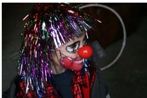
Carnaval de Lestiac

(Liste des évènements et partenariats : annexe 4)