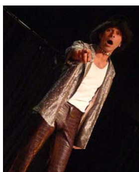
Répétition théâtrale, Cabaret du Cirque Eclair

Voilà deux temps indispensables à tout artiste pour entretenir et développer sa pratique artistique.