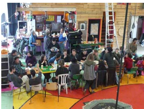
Repas convivial suite à un vide grenier

Il s'agit de permettre la construction d'un espace où art et culture riment avec convivialité, fraternité et solidarité.