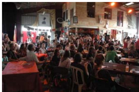
Soirée cabaret, printemps des arts

Un projet de création artistique nécessite à un moment donné, un public.