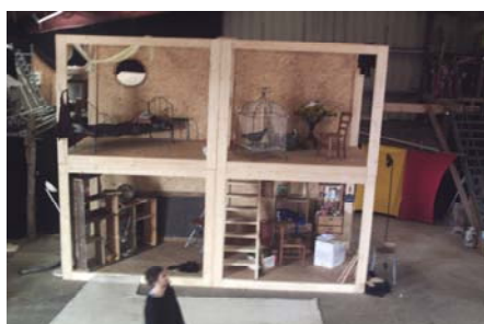
Espace polyvalent, création décor, Cie des gens ordinaires

En exemple : Chap'ka mobile (stockage chapiteaux), System No Mad (Tour Bus), La Caramélise (remorque cuisine), Le CRAC (caravane cinéma)... ( Liste des associations et compagnies adhérentes : annexe 3 )