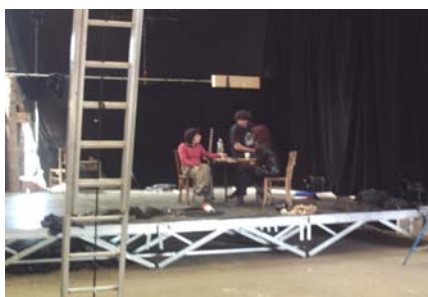
Espace polyvalent, création danse, Vita Nova

Favoriser la création dans toutes ses dimensions constitue un des axes forts du travail de l'équipe du Garage Lézarts auprès des artistes.